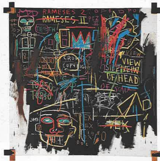
Kings of Egypt II, Museum Boijmans Van Beuningen, Rotterdam.

De expositie in Heerlen besteedt uitgebreid aandacht aan de Times Square Show. Niet alleen omdat deze tentoonstelling in de zomer van 1980 Basquiat als schilder een eerste openbaar podium bood. Door zijn omvang (er deden zo'n 100 jonge kunstenaars aan mee) werd de Show ook tot een afrekening met de esthetische opvattingen van het gevestigde kunstmilieu. Van de meer academische kunsttaal naar een punk-achtige beeldtaal, van museum naar straat en populaire cultuur, de Times Square Show zette een grote stap naar het neerhalen van de grenzen tussen hoge en populaire cultuur. Nieuw waren ook de middelen waarmee kunstenaars zich presenteerden. Mode, video