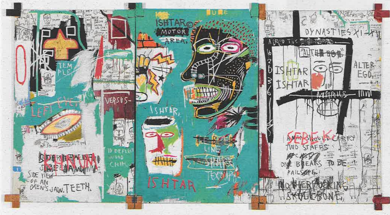
Ishtar, 1983. Ludwig Forum für Internationale Kunst.